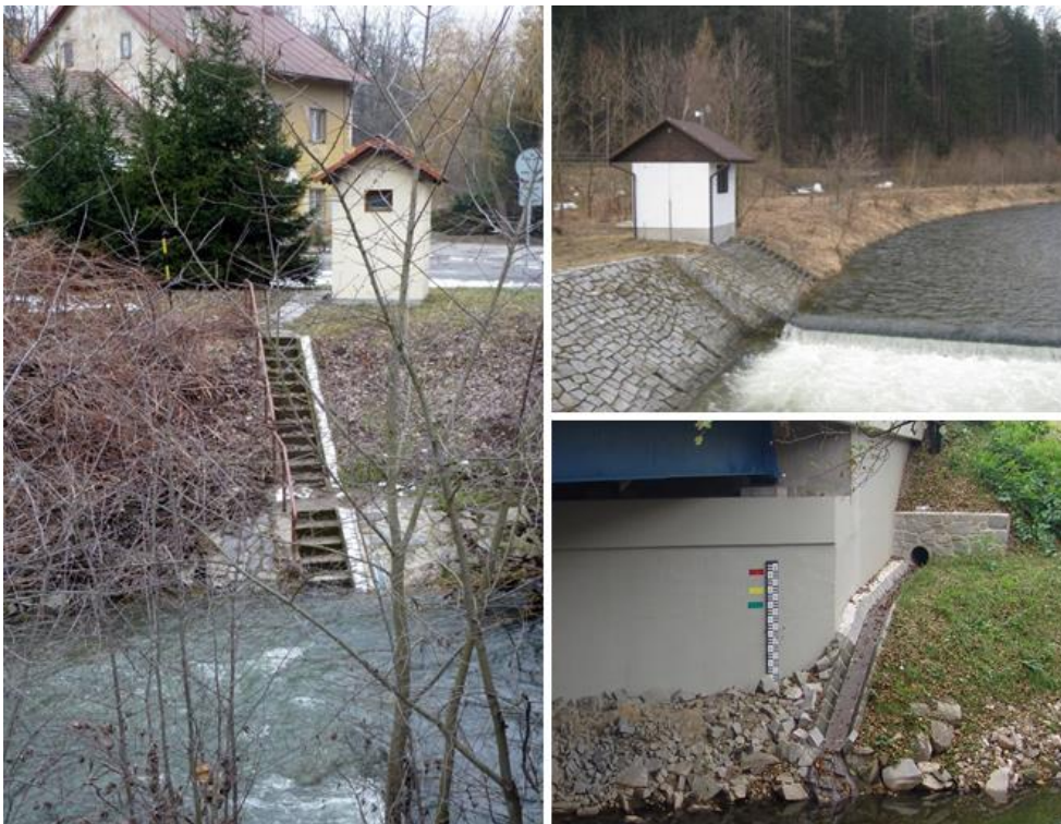
Obr. 2: Ukázka hlásných profilů (vlevo kategorie A, vpravo nahoře kategorie B, vpravo dole kategorie C).

Celý postup je poměrně náročný a do značné míry i závislý na osobních zkušenostech zainteresovaných pracovníků. V některých případech lze podle zkušeností nebo záznamů z minulých povodní přímo odhadovat vztah mezi situací v kritických místech a vodních stavech v hlásném profilu. V každém případě obsahuje postup řadu nepřesností, proto nemá smysl nastavovat ve směrodatných limitech SPA podrobnější rozlišení než 5 cm. Důležité je na úrovni jednotlivých obcí po každé větší povodni správnost nastavení směrodatných limitů SPA zpětně ověřovat a v případě potřeby navrhnout jejich úpravu.